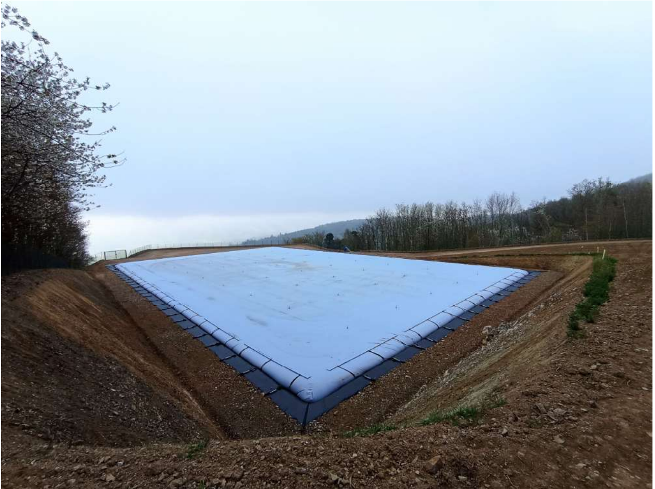
Citerne Placiau en avril 2023