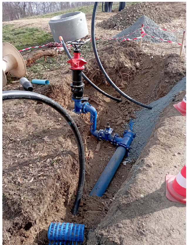
Pose de canalisations et borne en février 2023 (Tranche 2)